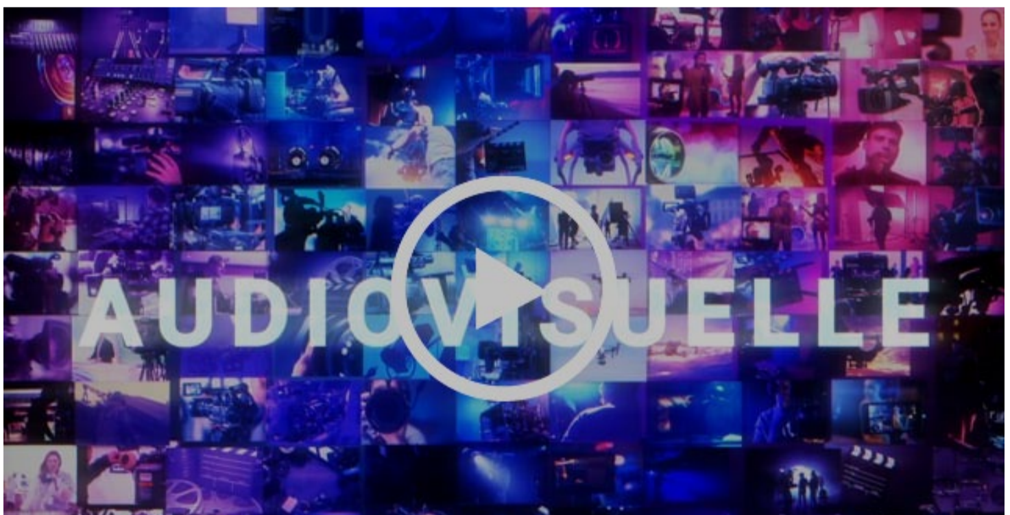
Exemple d'une capsule promotionnelle de 15 secondes produite pour AcademieCine.TV utilisant différentes techniques d'habillage visuel

L'objectif est de favoriser l'esthétisme de l'image et la dynamique de présentation pour bien transmettre le message et se démarquer de la compétition.